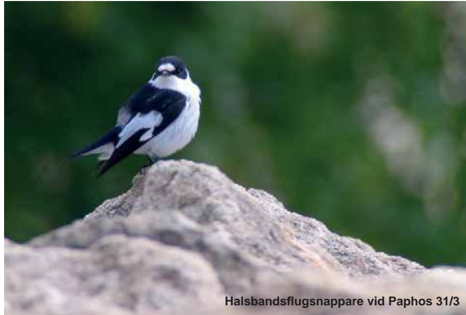
Halsbandsflugsnappare vid Paphos 31/3