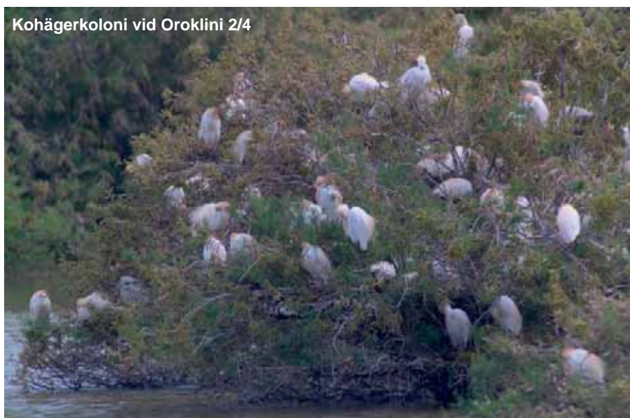
Kohägerkoloni vid Oroklini 2/4

1 ex mellan Paphos och Limasol 31/3, 1 ex Phassouri vassarna 31/3 och 1 ex norra Larnacadammarna 3/4.