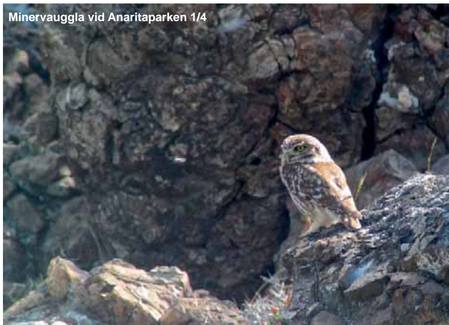
Minervauggla vid Anaritaparken 1/4

75. Rödfalk ( Falco naumanni ) Minst 1 ad hane och en hoa Achnasjön 2/4.