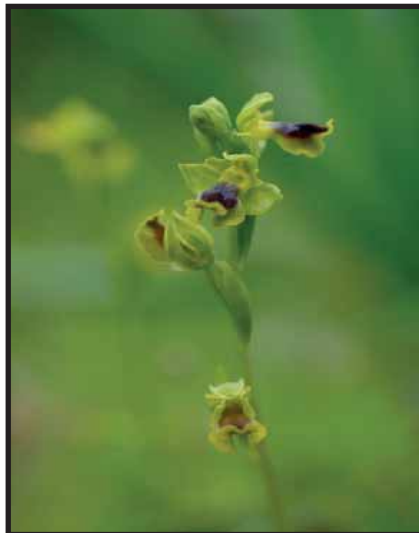
Ophrys lutea ssp. sicula