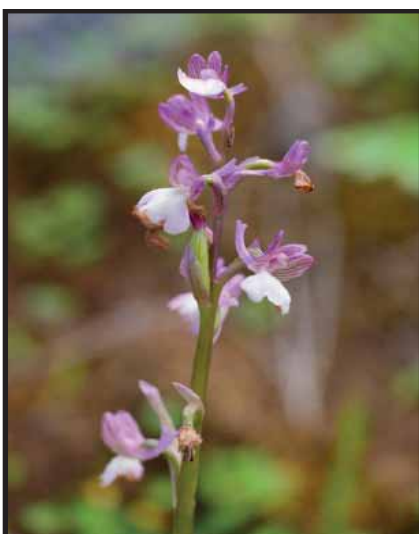
Anacamptis morio ssp. syriaca