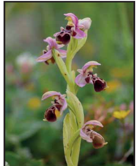
Ophrys umbilicata ssp. umbilicata