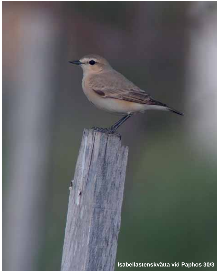
Isabellastenskvätta vid Paphos 30/3

Allmän i Paphoskogen och upp till Stavros tis Psokas 29/3, 1 hane Paphos 31/3 och 1 hona Anaritaparken 1/4.