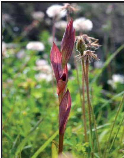
Serapias bergonii ssp. aphrodite