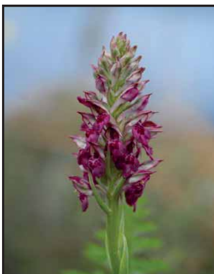
Anacamptis coriophora ssp. fragrans