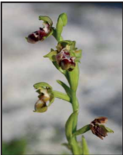
Ophrys umbilicata ssp. attica