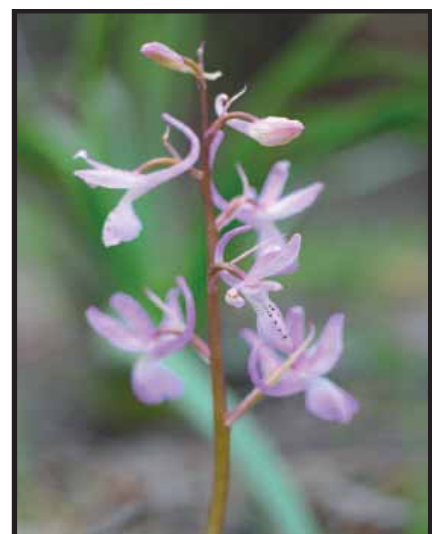
Orchis anatolica ssp. troodi