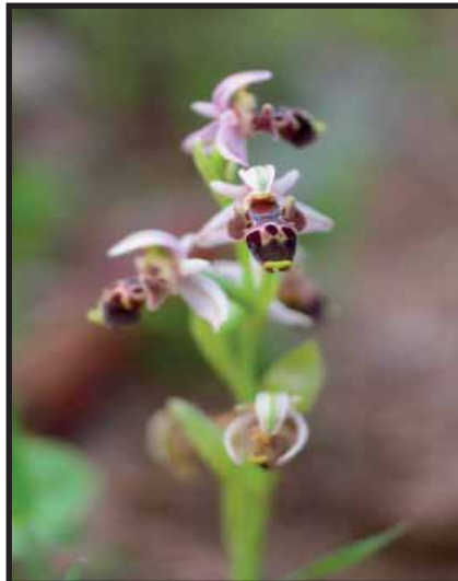
Ophrys umbilicata ssp. umbilicata