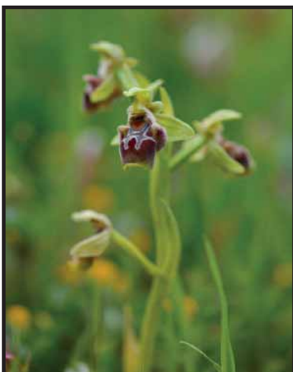
Ophrys umbilicata ssp. astarte