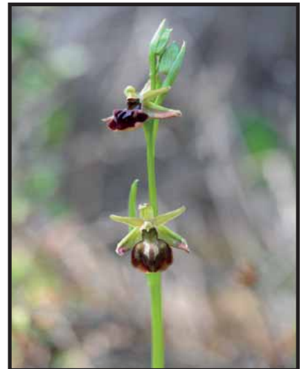
Ophrys herae ssp. herae