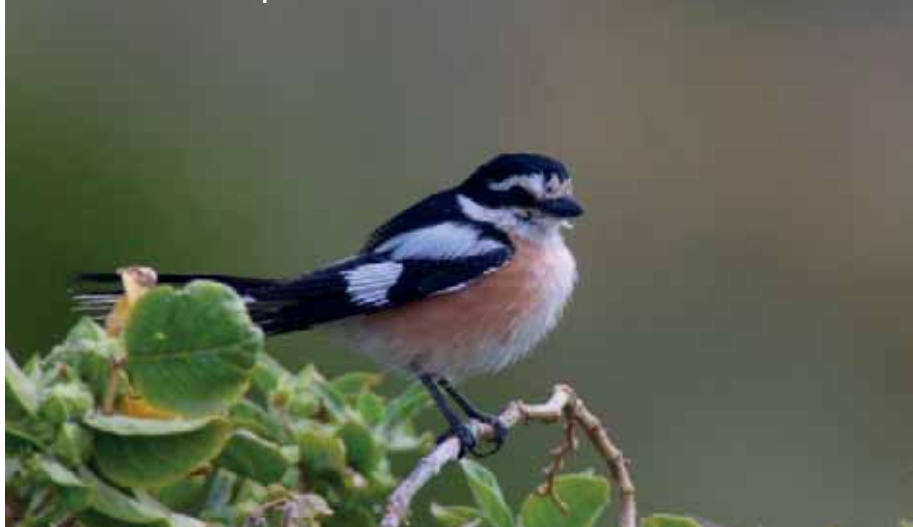
Masktörnskata vid Paphos 31/3