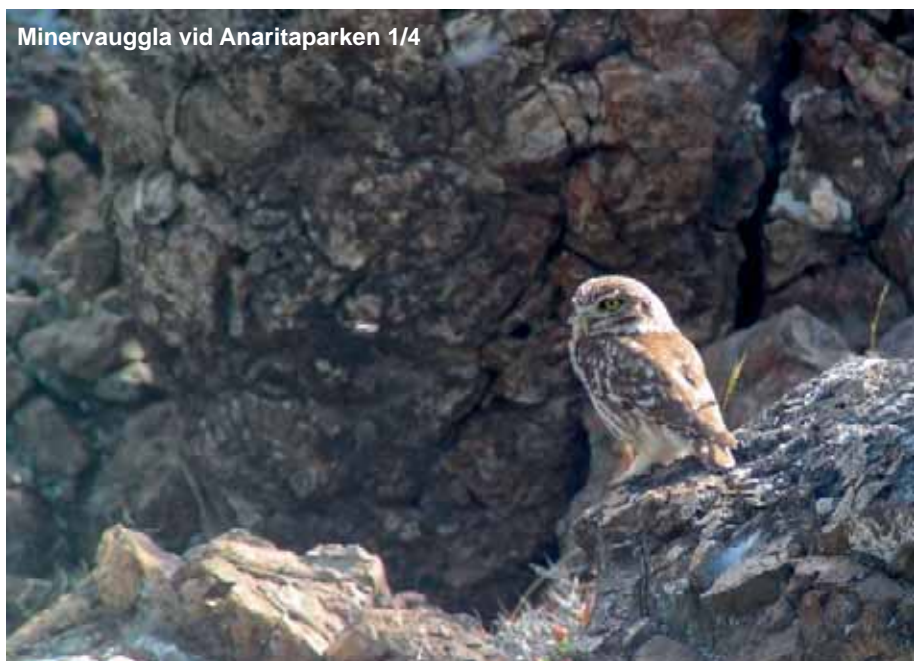
Minervauggla vid Anaritaparken 1/4

Minst 1 ad hane och en hoa Achnasjön 2/4.